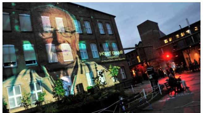
Wenn Details riesengroß werden. Die Videoinstallation läuft.