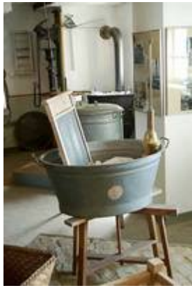
Abb. 2011-3/317 Freilichtmuseum Roscheider Hof: Die Irreler Bauerntadition zeigt das Handwaschen im Rahmen des Handwerker und Bauerntags 2008 http://de.wikipedia.org/wiki/Wäsche_(Textilien)#Geschichte