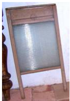
Abb. 2011-3/321 Waschbrett mit gläsernem Einsatz, Rahmen Buchenholz Inschrift nicht lesbar Wikipedia DE ... Waschbrett: ... Tranby House Washing boards, 2006, Gnaragarra, Australia