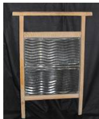
Waschbrett mit gläsernem Einsatz, welches im Glasmuseum Weißwasser zu sehen ist