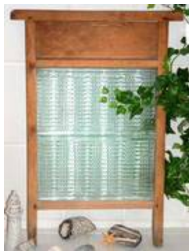
Abb. 2011-3/319 Waschbrett mit 2 gläsernen Einsätzen, Rahmen Buchenholz 2 Glasscheiben H 15,8 cm, B 28,5 cm, wagrecht geteilt auf dem unteren Rand der Scheiben eingepresst: „Marke STAHLGLAS Feinwäsche“ bzw. „... Grobwäsche“ Holzrahmen H 55,3 cm, B 38,8 cm Hersteller unbekannt, Deutschland, 1930-er Jahre http://de.dawanda.com/product/10712490 ... vgl. Sammlung Boschet vgl. Sammlung Wessendorf Nr. 7243 www.pressglas-pavillon.de/misc/07243.html