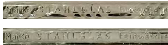
Abb. 2011-3/318 Glasscheibe als Einsatz in ein Waschbrett farbloses Pressglas, H ??? cm, B ??? cm Sammlung Wessendorf Nr. 7243 eingepresste Inschriften „Marke STAHLGLAS Feinwäsche“ bzw. „...Grobwäsche“ vgl. Sammlung Boschet [www.pressglas-pavillon.de/misc/07243.html]