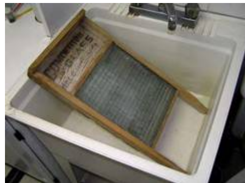
Abb. 2011-3/320 Waschbrett mit gläsernem Einsatz, Rahmen Buchenholz Inschrift „Competitor Glass Made in Canada“ Wikipedia DE ... Waschbrett: ... Glass washboard, early twentieth century, photo by Yannick Trottier 2005