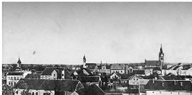
Stadtansicht von Penzig um 1900