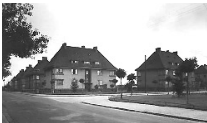
Siedlungshäuser der Glasmacher in den 40-er Jahren des vorigen Jahrhunderts.

Mit dem Bau von Siedlungshäusern sind Glasbläser aus noch älteren Glasmacherstandorten der Oberlausitz wie Rauscha und Bernsdorf herangezogen worden, die Fachkräfte kamen aber auch aus Böhmen und Polen. Aufgrund der günstigen Bedingungen, die mit der Lage von Penzig, auch wegen der rohstoffreichen Görlitzer Heide, verbunden waren, gründeten sich weitere Glasbetriebe. Somit stieg die Einwohnerzahl des einstigen, verträumten Heidedorfes, welches vorher ausschließlich von der Landwirtschaft geprägt war, von 630 im Jahre 1825 auf 6.305 im Jahre 1905 an und erreichte ihren Höchststand kurz vor dem Ausbruch des 2. Weltkrieges mit 7.305 Einwohnern.