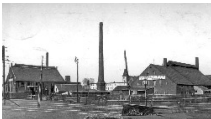
Glashüttenwerke Phönix GmbH in Penzig um 1906