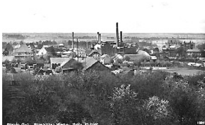
Das Glaswerk der Gebrüder Putzler GmbH in Penzig um 1925